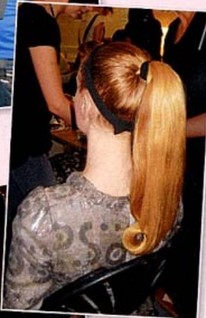
▶ ... Glamour-Pferdeschwanz