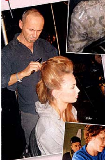
◀ Für das Megavolumen von Marchesa ...