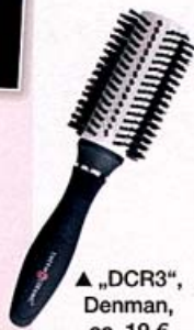
▲ „DCR3“, Denman, ca. 19 €