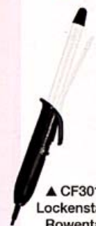
▲ CF301, Lockenstab: Rowenta, ca. 22 €

Es war die Modeparty des Jahres: Swarovski Fashion Rocks in der Londoner Royal Albert Hall. 12 Designer zeigten ihre Haute Couture zu Liveacts von Alicia Keys bis Shirley Bassey. Hinter den Kulissen: Akkordarbeit – 50 Aveda-Stylisten, über 140 Models und für jede Frisur nur zehn Minuten Zeit! Hier die Ruckzuck-Geheimnisse der Stylisten für drei Trend-Looks: