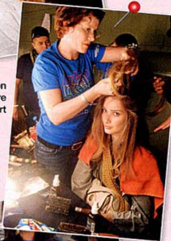
▶ ... werden die Haare kräftig toupiert