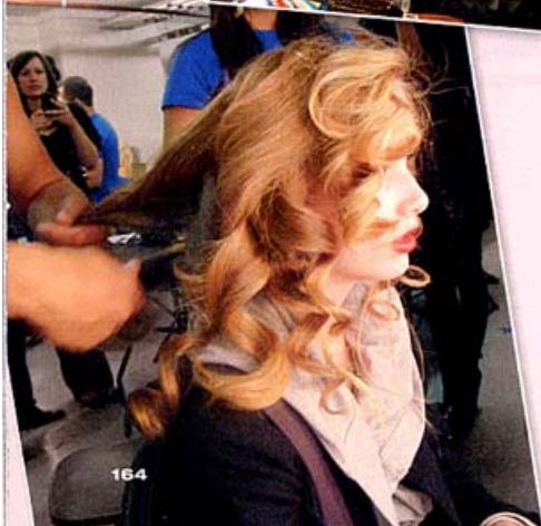
▼ Locken satt gab es bei Gucci